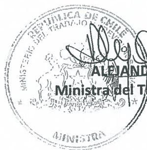
ALEJANDRA KRAUSS VALLE Ministra del Trabajo y Previsión Social